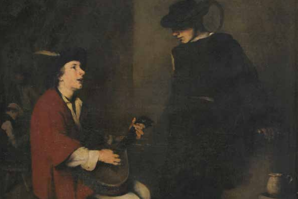
Théodule Ribot, Joueurs de guitare , musée des beaux-arts de Reims