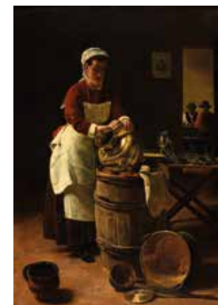
François Bonvin, L'Écureuse , musée des beaux-arts de Reims