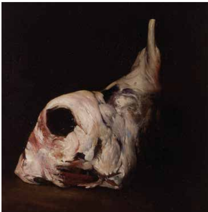
Théodule Ribot, Un Gigot , musée de Picardie, Amiens

Certains critiques admiraient la simplicité de ses natures mortes, et particulièrement sa capacité à révéler le potentiel tactile des objets. D'autres louaient sa façon de traiter la lumière, souvent subtilement dramatique mais sans aucune théâtralité. Pour qu'il en ait autant produit, il semble que Ribot ait trouvé des collectionneurs pour ce genre. Auguste Rodin, séduit par ces compositions, en acquit plusieurs.