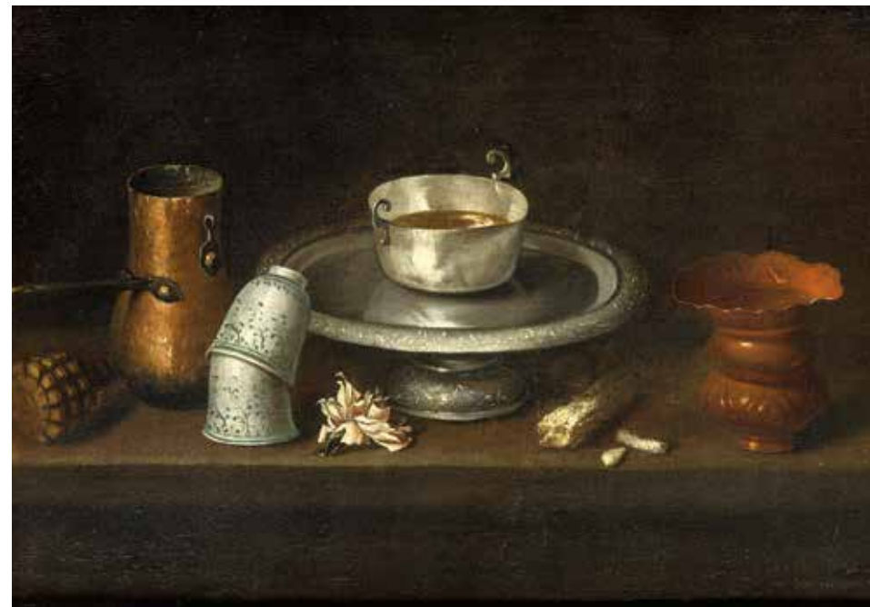
Juan de Zurbarán, Nature morte au bol de chocolat , musée des beaux-arts et d'archéologie de Besançon

D'autres tableaux, comme L'Huître et les plaideurs montrent comment l'artiste passa de scènes tirées de la Bible à l'illustration d'une fable de Boileau, satire de la justice. Cette œuvre fut achetée par l'État, avec une autre, Les Philosophes . Cette reconnaissance permit à Ribot de créer des compositions à plus grande échelle, dans la veine de ses compositions religieuses de la même décennie.