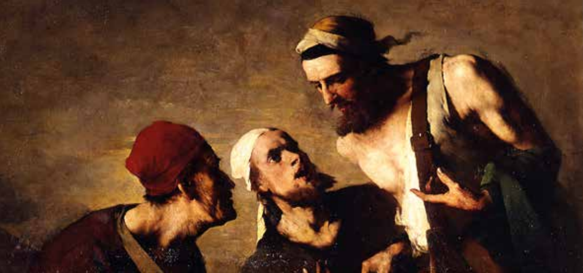
Théodule Ribot, L'Huitre et les plaideurs , musée des beaux-arts de Caen