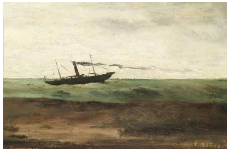
Théodule Ribot, Marine , musée Singer Laren

Les paysages ne sont pas nombreux dans l'œuvre de Ribot : c'est surtout au début de sa carrière qu'il s'intéressa au paysage, genre qu'il délaissa par la suite. Lorsque les Prussiens envahirent l'île de France en 1870, ils détruisirent plus de cinquante tableaux dans son atelier. Beaucoup d'entre eux étaient peut-être des paysages. Il ne reste que quelques petites compositions qui démontrent la sensibilité de Ribot à l'égard de ce thème, dans l'esprit des extérieurs atmosphériques de Corot.