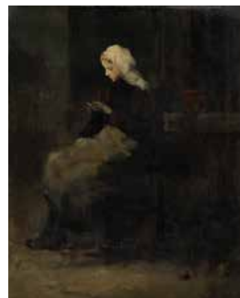
Théodule Ribot, La Tricoteuse , musée des beaux-arts de Marseille