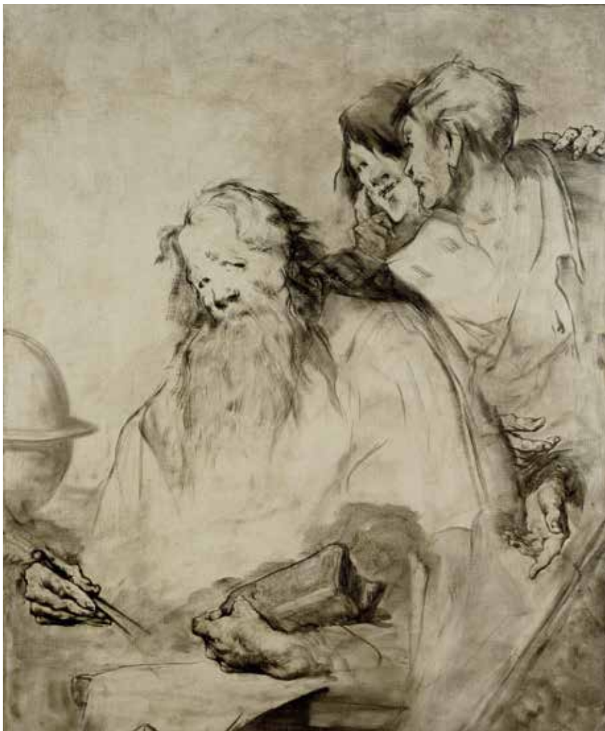
Théodule Ribot, Héraclite , musée de Picardie, Amiens

D'autres tableaux, comme L'Huître et les plaideurs montrent comment l'artiste passa de scènes tirées de la Bible à l'illustration d'une fable de Boileau, satire de la justice. Cette œuvre fut achetée par l'État, avec une autre, Les Philosophes . Cette reconnaissance permit à Ribot de créer des compositions à plus grande échelle, dans la veine de ses compositions religieuses de la même décennie.