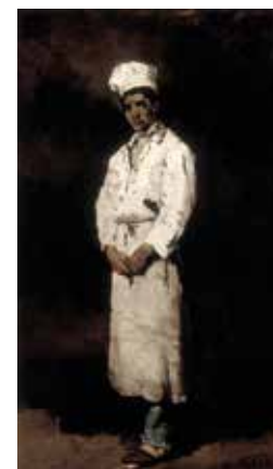
Théodule Ribot, Mitron , musée des beaux-arts de Marseille