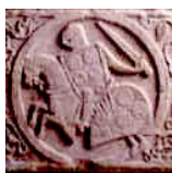
Sarcophage de la famille de Palais