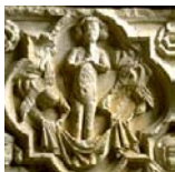
Sarcophage dit « du grand Prieur »

Voici les sépultures de deux hommes du Moyen Age. Que voit-on ?