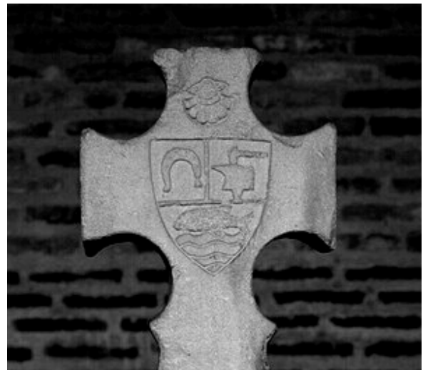
Détail - face

Cette croix marquait l'emplacement de la tombe d'une femme nommée Dame Guillemette.