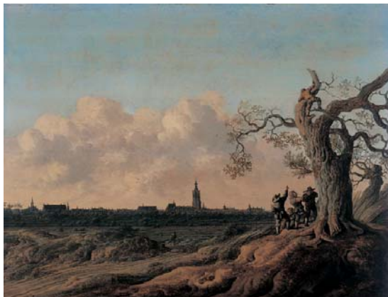
Anthony Jansz van der Croos La Haye vue du nord ou Les dénicheurs d'oiseaux