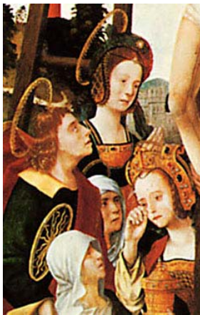
Anonyme hollandais, Descente de croix , deuxième moitié du XV e siècle (détail)