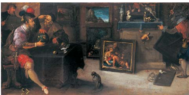
Frans II Francken, Cabinet d'amateur attaqué par un âne iconoclaste