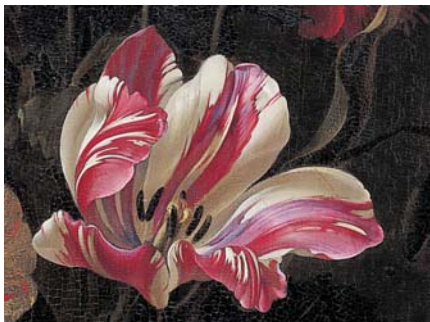
Pieter II van Aelst, Vase de fleurs (détail)