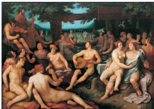
Cornelis van Haarlem, L'Humanité avant le Déluge .