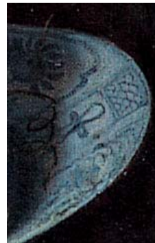
Van den Bosch, Nature morte de fruits avec coupe d'argent (détails de la porcelaine chinoise)