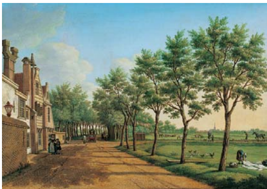
Paulus Constantijn La Farge, La Haye : le chemin menant à Rijswijk , 18 e siècle