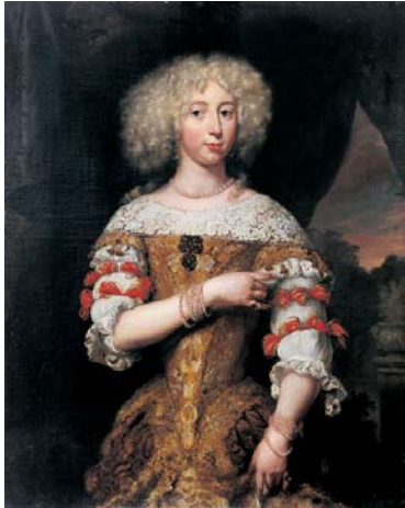
Nicolas Maes, Portrait d'une femme