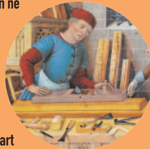
Jean Bourdichon, L'État du travail dans les Quatre États de la Société , vers 1505-10, détail : menuisier au travail devant son établi. Paris, ENSBA.