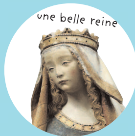
une belle reine