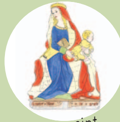
2 ème repaint