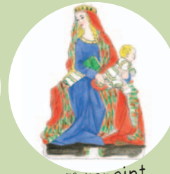
3 ème repaint