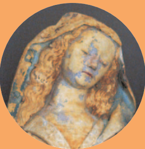
Vierge à l'Enfant, (après restauration), église de Gommecourt (Yvelines).