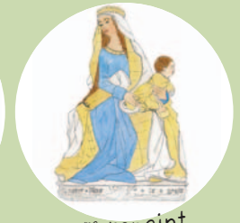
4 ème repaint

Pour la restaurer, l'équipe du musée et les restaurateurs ont choisi de dégager les différentes couches de repeints pour retrouver la peinture d'origine, celle qui a été posée au moment de sa création. Pour cette intervention très délicate, les spécialistes ont utilisé un scalpel