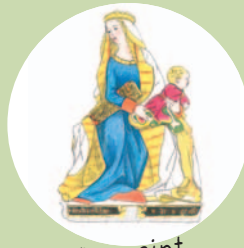
1 er repaint