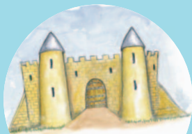
un château fort